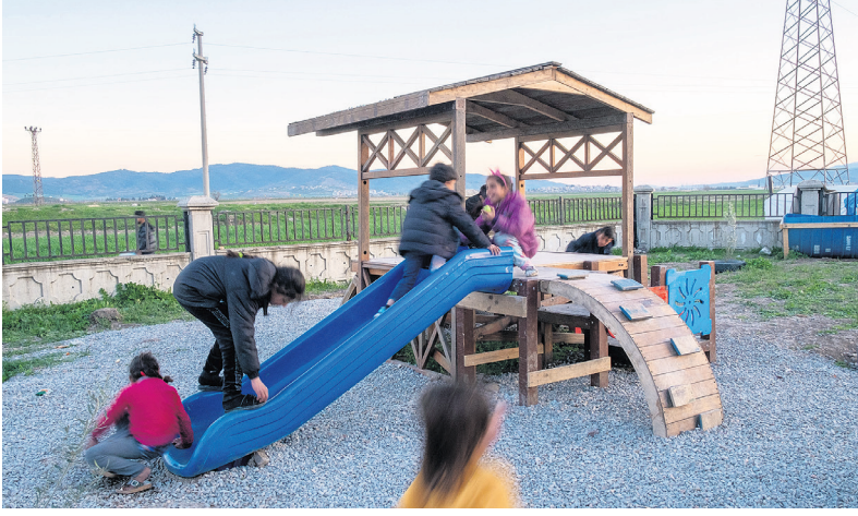
-Herkes İçin Mimarlık ve Oyun Parkı Kolektifi ve Kaf Komün dayanışması ile üretilen oyun parkı birimleri.