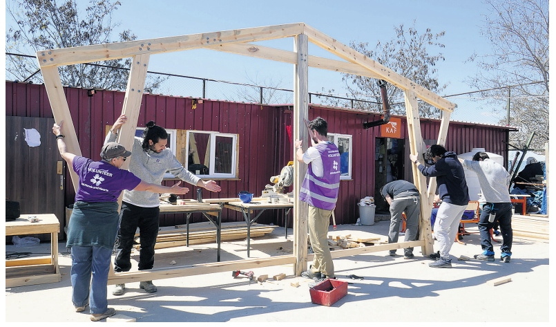
Herkes İçin Mimarlık, All Hands and Hearts ekibi, topluluk merkezi strüktürü.

gördüğümüz Dulkadiroğlu Sümer Mahallesi, Pazarcık Bağdınisağır Mahallesi, Elbistan Konteyner Kent Alanı, Türkoğlu 23 Nisan Parkı gibi keşiflerin ardından Kaf Kolektif'in konuştuğu Sümer Ortaokulu'nda açık, yarı açık ve kapalı mekanlar içeren ilk topluluk merkezini konumlandırma kararı aldık. İlk durağımız ve partnerimiz olan Kaf'ın mahalleyle dair uzun vadeli projeksiyonları, mahalleliyle kurmuş oldukları ilişkiler ve bizim karşılıklı ortak niyet diyalogumuz bu kararın verilmesinde etkili oldu.