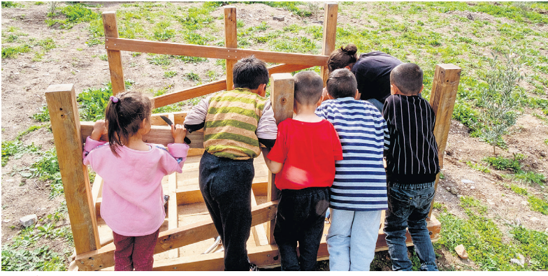
Herkes İçin Mimarlık ve Oyun Parkı Kolektifi'nin çikma malzemelerden ürettiği oyun parkı malzemeleri montajı.