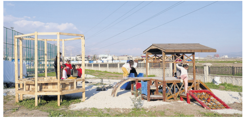
Herkes İçin Mimarlık, Oyun Parkı Kolektifi ve Kaf Komün dayanışması ile üretilen oyun parkı birimleri.

açıları kazandırmak fikrini de besliyor. Hatta sadece lisans değil, lisans öncesi ve sonrası tasarım ve mimarlık eğitimi hakkında üzerine düşünmemizi, fikirler geliştirmemizi sağlıyor. Üretim felsefemizi adlandıracak olursak da buna 'birlikte yapmak' diyebiliriz.